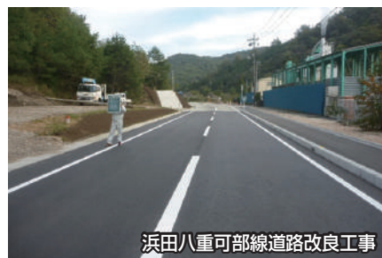
浜田八重可部線道路改良工事