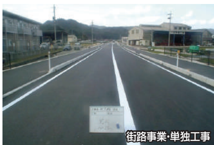
街路事業・単独工事