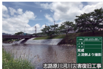
志路原川河川災害復旧工事

道路や河川の施工に携わる事で北広島町の生活環境の構築と地域の発展に貢献できる、やりがいのある仕事をしています。 様々な工事を経験し技術者としてのレベルアップにつながるよう、会社でしっかりバックアップ致します。