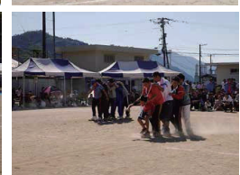
〈社内行事〉社員旅行、ソフトボール大会、運動会