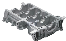
シリンダーブロックロア